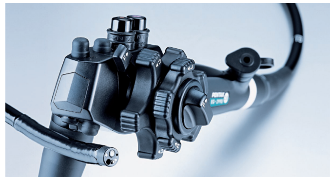
Spitze und Griff Koloskop

Da jedoch auch bei regelmäßiger Medikamenteneinnahme bei Colitis-ulcerosa-Patienten das Risiko für Darmkrebs noch erhöht ist, werden zur Vorsorge zusätzlich Darmspiegelungen mit der Entnahme von Gewebeproben empfohlen. Fragen Sie Ihren Arzt!